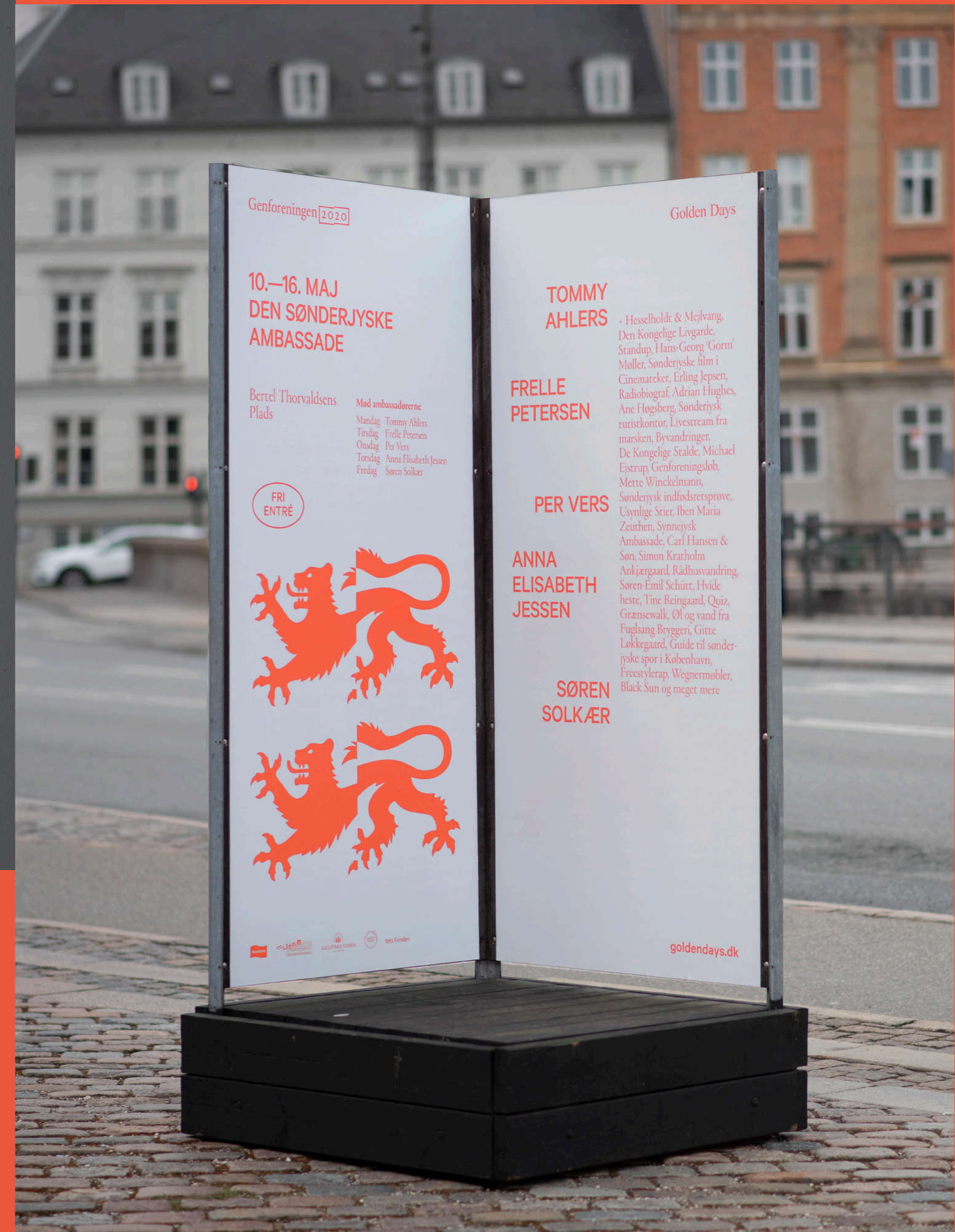
Identiteten brugt aktivt på gadestandere og programforside