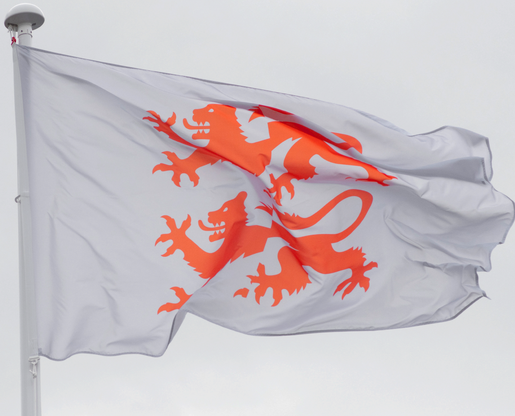
Flag og plakater der gør brug af de brudte sønderjyske løver og det brudte typografiske udtryk