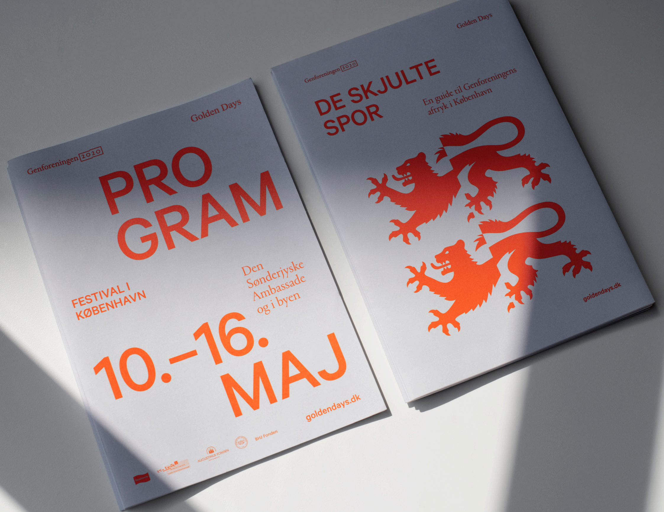
Design af sønderjysk pas og program med tilhørende kort over hvor i København man kan opleve Genforeningens aftryk