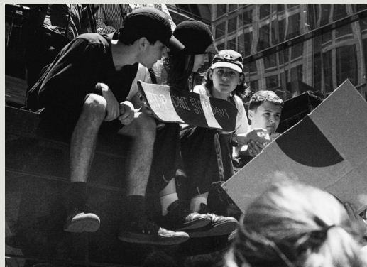
Civilsamfundet er Demokratiets Immunforsvar

Frie Grønne — Danmarks Nye Venstre/fløjparti Politisk platform