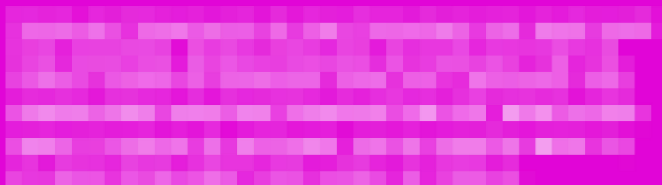
FOR TÆT PÅ STRÅLERNE