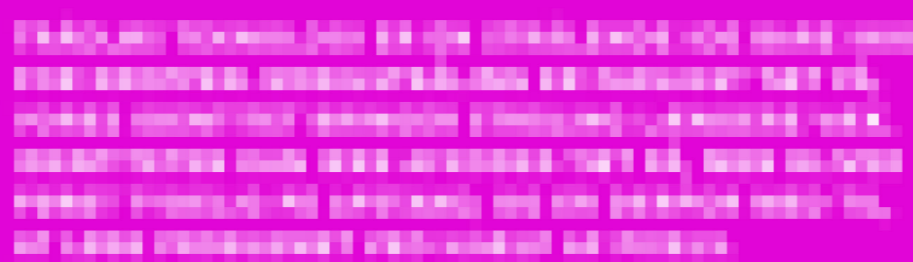
STADIG FOR TÆT PÅ STRÅLERNE